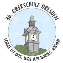
Bild- und Literaturquellen